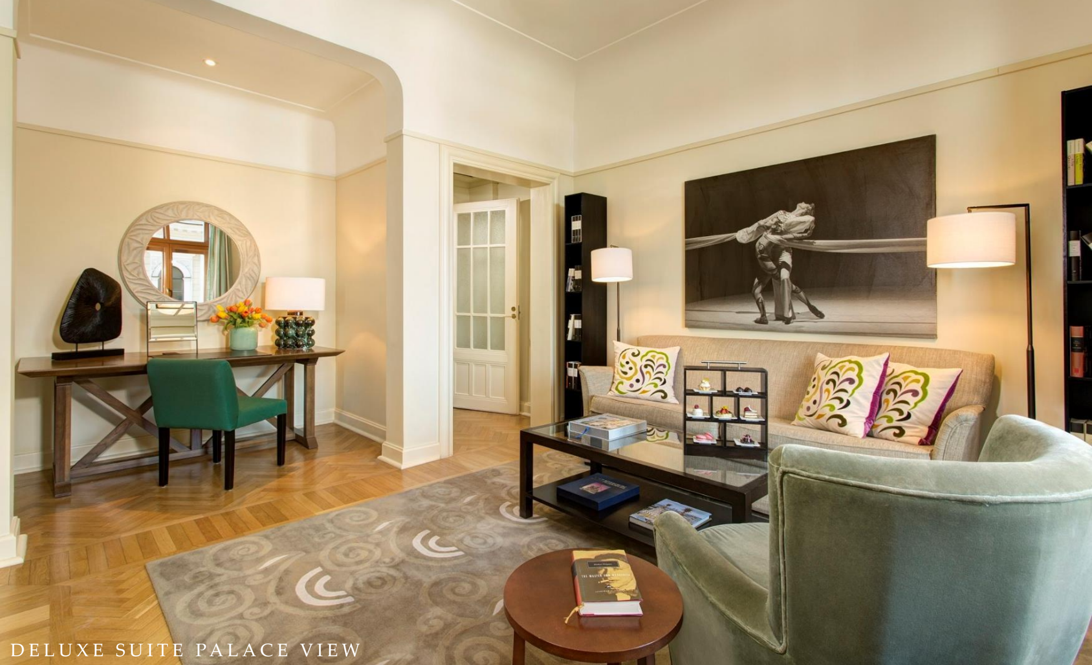
DELUXE SUITE PALACE VIEW