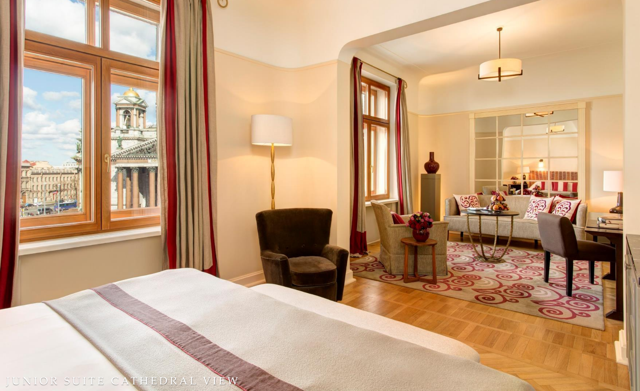
JUNIOR SUITE CATHEDRAL VIEW